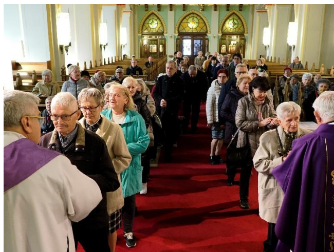
76 idős és beteg vette fel a betegek szentségét templomunkban, március 22-én.