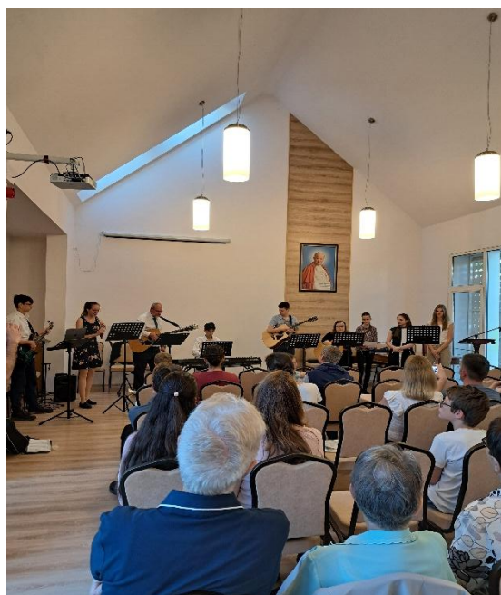
A tavalyi házimuzsika egy képe