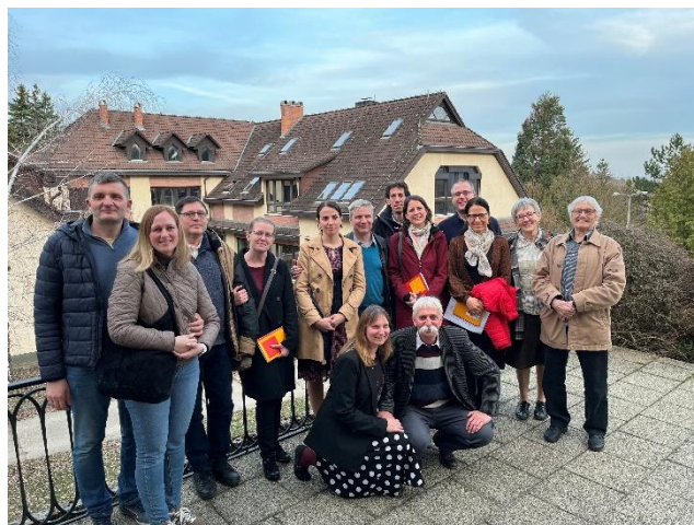
Házasság-hétvégi kis csapatunk

belőle, hogy a szenvedés nem pusztítja el a hitet, hanem elmélyíti.